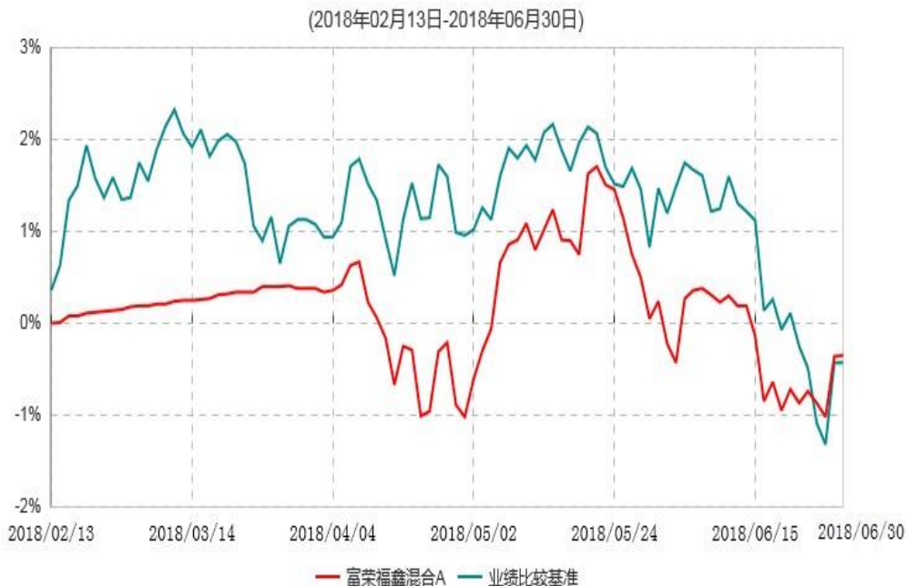
富荣福鑫混合A累计净值增长率与业绩比较基准收益率历史走势对比图

注：①本基金基金合同于 2018 年 2 月 13 日生效，截止 2018 年 6 月 30 日止，本基金成立未满一年；