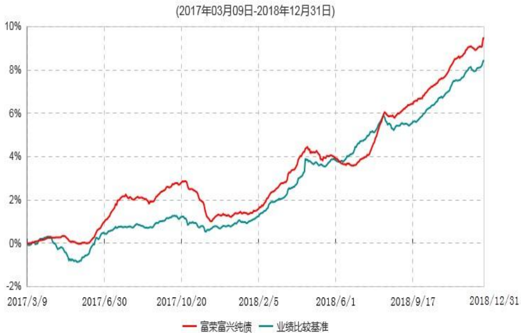
富荣富兴纯债债券型证券投资基金累计净值增长率与业绩比较基准收益率历史走势对比图