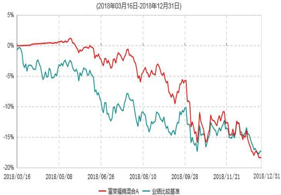
富荣福锦混合A累计净值增长率与业绩比较基准收益率历史走势对比图

注：①本基金基金合同于2018年3月16日生效，截止2018年12月31日止，本基金成立未满一年；