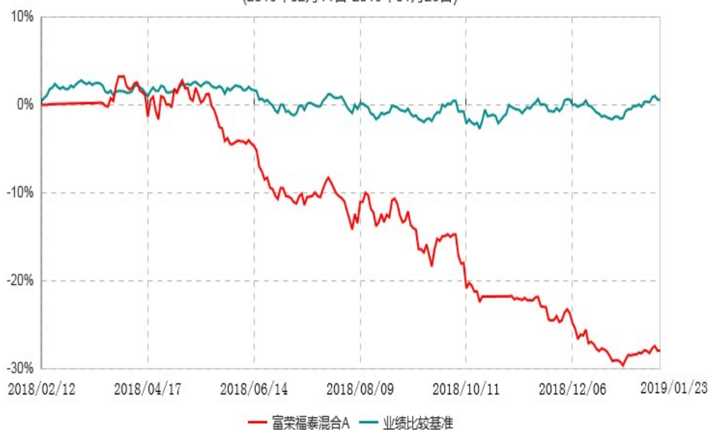
富荣福泰混合C累计净值增长率与业绩比较基准收益率历史走势对比图