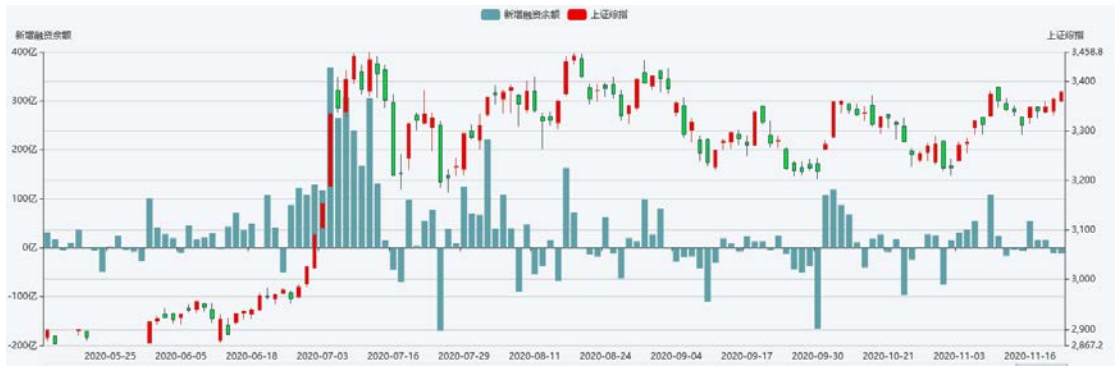
数据：Wind；图：富荣基金量化组

风险提示：1、本报告中的信息均来源于我们认为可靠的已公开资料和合作客户的研究成果，但本公司及研究人员对这些信息的准确性和完整性不作任何保证，也不保证本报告所包含的信息或建议在本报告发出后不会发生任何变更，且本报告仅反映发布时的资料、观点和预测，可能在随后会作出调整。2、本报告中的资料、观点和预测等仅供参考，在任何时候均不构成对任何人的个人推荐。市场有风险，投资需谨慎。