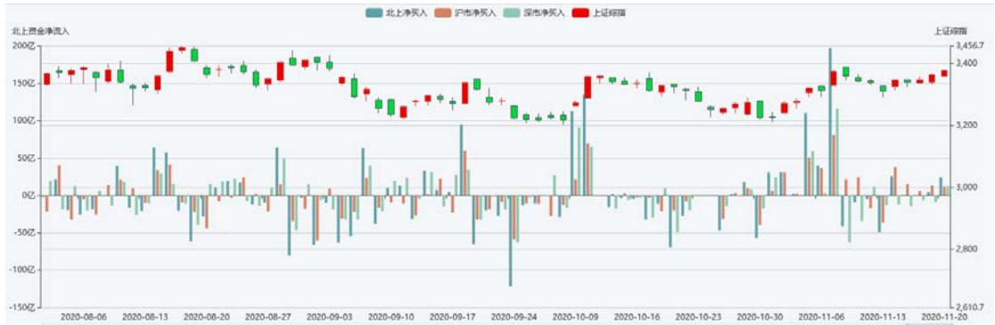
图 2 北向资金流动

从资金流动来看，本周北向资金合计流入 55.10 亿，其中沪股通流入 84.40 亿，深股通流出-29.29 亿。如下图：