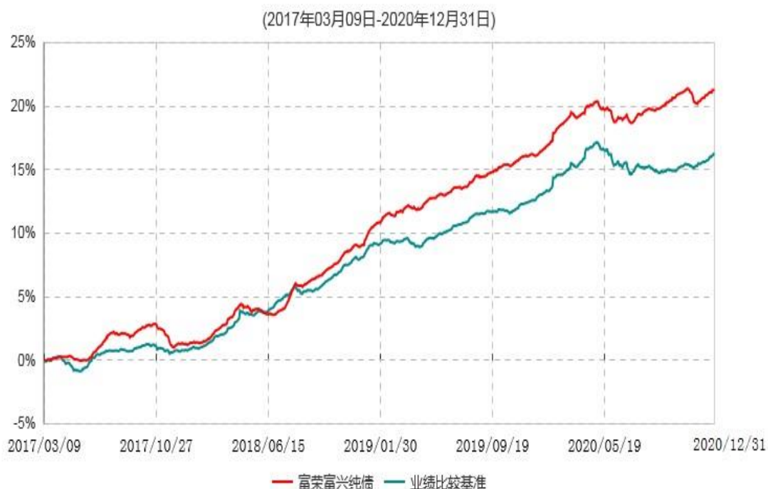
富荣富兴纯债债券型证券投资基金累计净值增长率与业绩比较基准收益率历史走势对比图