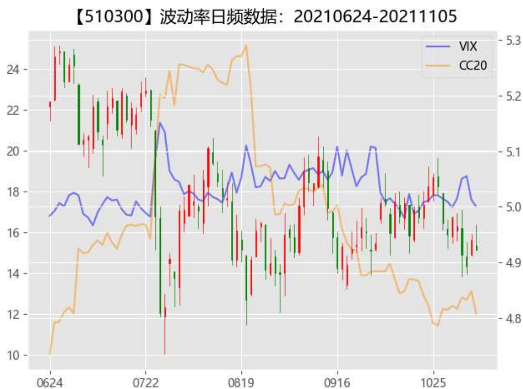
图 2：期权市场隐含波动率

流入 0.62 亿，深股通流入 43.52 亿。现货市场窄幅震荡下沪深 300、上证 50 股指期货继续出现小幅度升水，隐含波动率大幅度回落后在低位持续震荡徘徊。市场交投情绪进一步压缩，美联储 FOMC 会议结束，短期事件冲击纷纷落地，风险指标低位震荡已经有较长时间，投资者要特别小心市场可能出现方向选择进而引发一波震荡，期权市场投资者应谨慎卖空波动率。