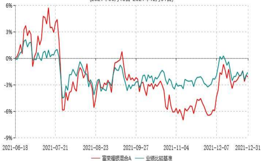
富荣福银混合C累计净值增长率与业绩比较基准收益率历史走势对比图