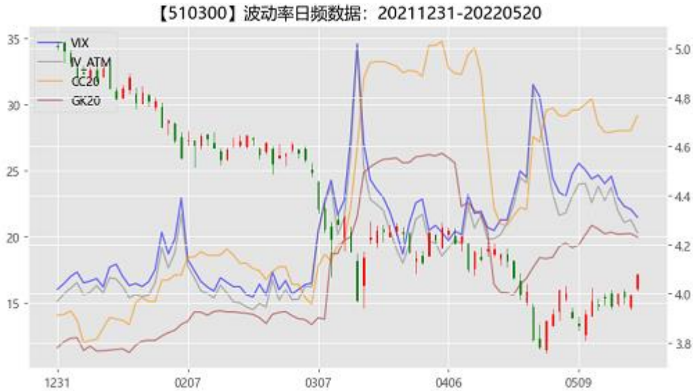
图 2：期权市场隐含波动率

从资金流动来看，北向资金本周净流入，全周合计流入 152.18 亿，其中沪股通流入 114.89 亿，深股通流入 37.29 亿。市场进入多事之秋后的调整期，投资者风险偏好改变，波动率被拉高然后在高位徘徊，市场进入一个新的平台期需要时间。