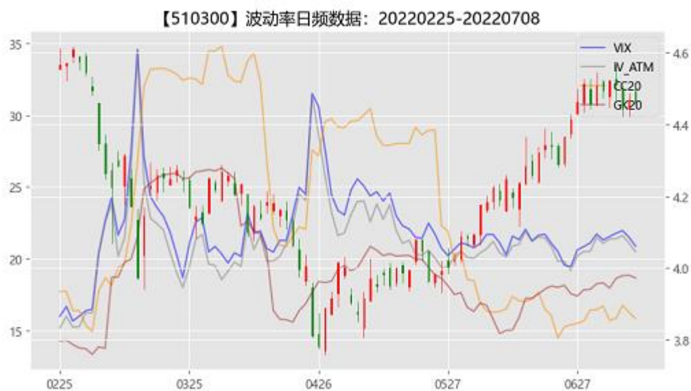
图 2：期权市场隐含波动率