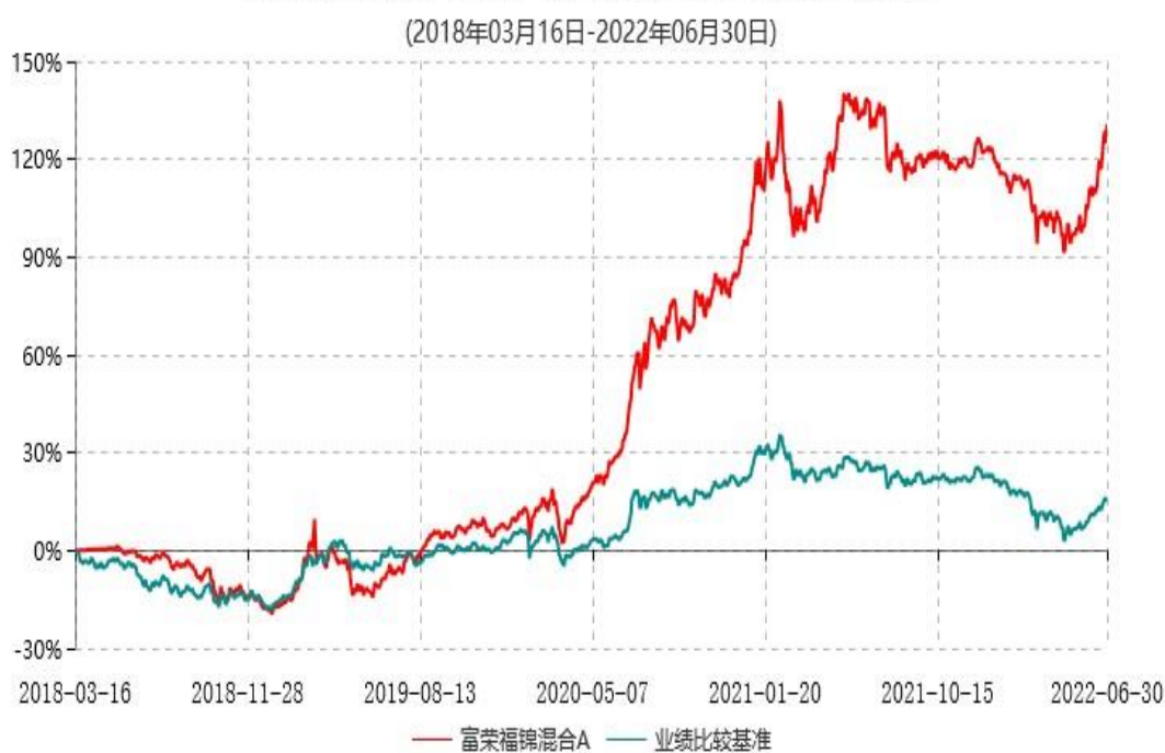
富荣福锦混合A累计净值增长率与业绩比较基准收益率历史走势对比图