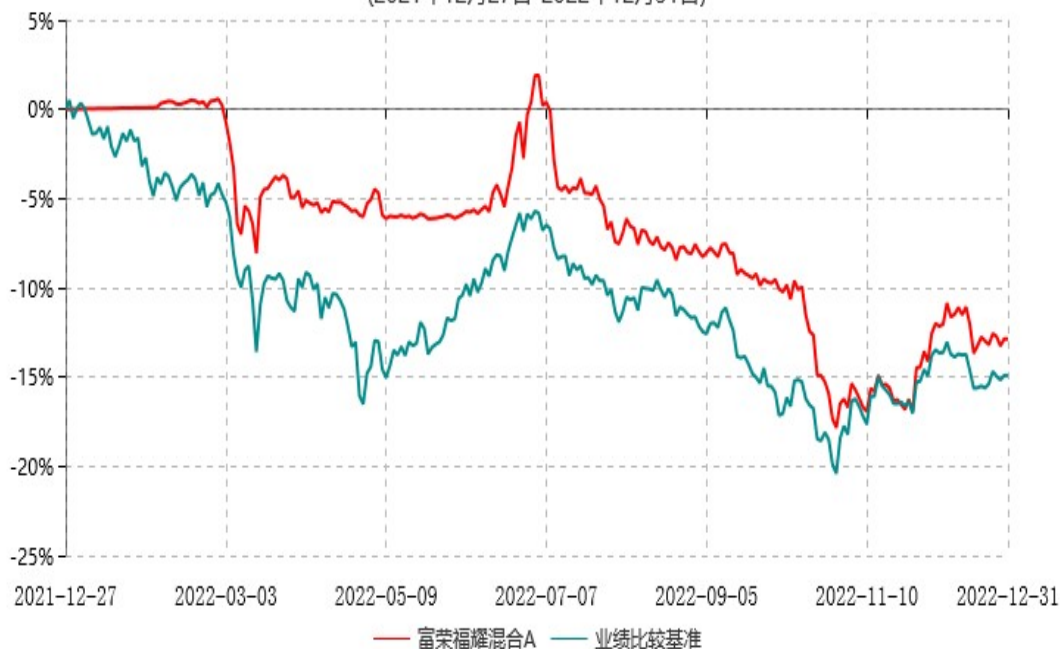
富荣福耀混合C累计净值增长率与业绩比较基准收益率历史走势对比图