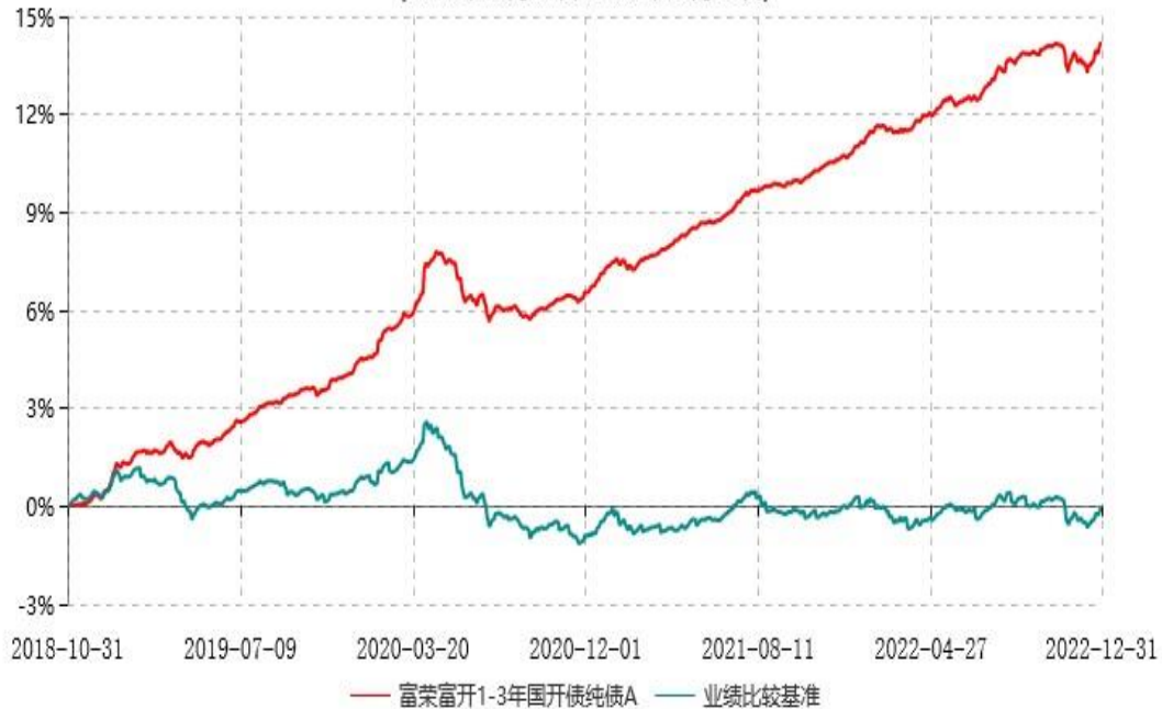
富荣富开1-3年国开债纯债A累计净值增长率与业绩比较基准收益率历史走势对比图 (2018年10月31日-2022年12月31日)