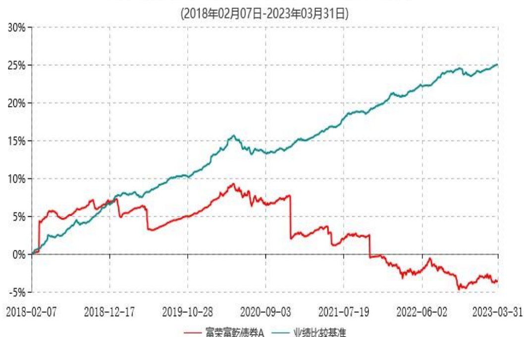
富荣富乾债券A累计净值增长率与业绩比较基准收益率历史走势对比图