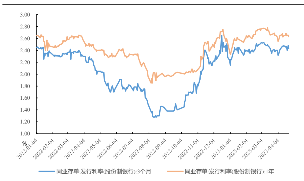
图 1、CD 发行利率上行

上周（4.17-4.21）银行同业存单发行 7920 亿元，净融资 2201 亿元。一级 CD 发行利率方面，1 月期上行 7.5bp 至 2.13%，3 月期下行 7.43bp 至 2.40%，6 月期上行 4.4bp 至 2.58%，1 年期利率上行 1.11bp 至 2.65%。二级市场收益率方面，1 月期存单利率上行 5bp 至 2.34%，3 月期存单利率下行 0.26bp 至 2.42%，6 月期存单利率下行 0.89bp 至 2.49%，9 月期存单利率上行 0.68bp 至 2.58%，1 年期存单利率上行 1.75bp 至 2.63%。3 月期、1 年期收益率分别处在 35.05%、31.70%历史分位数。