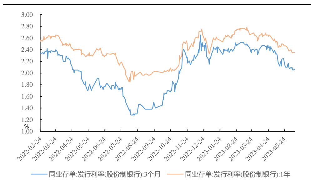
图 1、CD 发行利率下行

6月5日-6月11日银行同业存单发行规模回升至6509.5亿元，净融资小幅升至828.4亿元，本周存单到期量7144.1亿元。一级存单发行利率方面，1月期存单利率上行8.7bp至2.1%，3月期、6月期、9月期、1年期存单利率分别下行2.9bp、4.5bp、10.8bp、3.1bp至2.3%、2.3%、2.3%、2.4%、2.38%。二级市场收益率方面，1月期同业存单收益率上升0.47bp至2.03%，3月期同业存单收益率下降5bp至2.04%，6月期同业存单收益率下降3.71bp至2.14%，9月期同业存单收益率下降2.77bp至2.26%，1年期同业存单收益率下降5.42bp至2.31%。