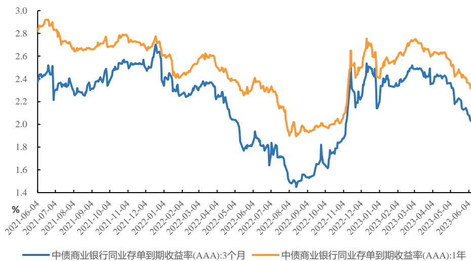
图 2、CD 收益率下行