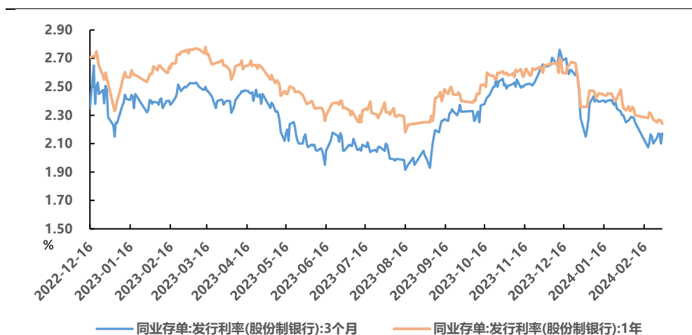
图 1、存单一级发行利率

亿元，净融资降至 574.0 亿元，本周存单到期量 5720.2 亿元。一级市场加权平均发行期限 0.62 年，相对于前一周小幅上升。发行利率方面，上周 1M 期限下行 2.56bp 至 2.08%，3M 期限上行 7.13bp 至 2.17%，6M 期限下行 1.17bp 至 2.20%，9M 期限下行 0.67bp 至 2.25%，1Y 期限下行 3.05bp 至 2.24%。二级市场方面，1Y 以下期限存单到期收益率出现回落。1M 期收益率收于 1.81%；3M 收于 2.14%；6M 收于 2.18%；9M 收于 2.21%；1Y 收于 2.25%。