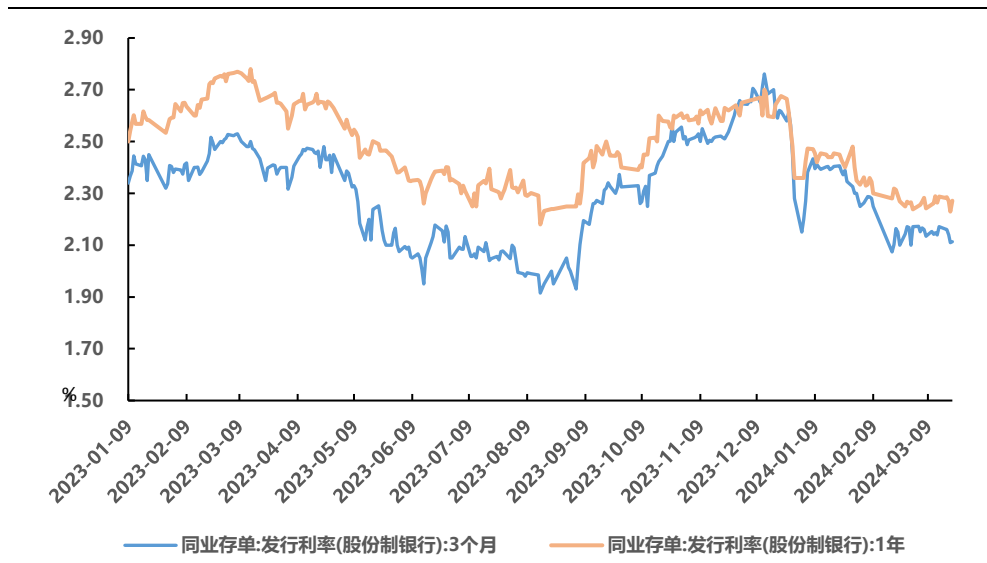
图 1、存单一级发行利率

同业存单净融资 4071 亿元，二级短端下行较多。上周同业存单共发行 11286 亿元，较前一周增加 4593 亿元，净融资 4071 亿元。存单加权期限为 6.88M，1 年期存单发行量占总发行量比重为 30%。发行利率方面，1M 期限下行 1.51bp 至 2.21%，3M 期限下行 5.88bp 至 2.11%，6M 期限下行 8bp 至 2.20%，9M 期限下行 0.66bp 至 2.23%，1Y 期限下行 1.51bp 至 2.27%。二级市场方面，存单收益率下行，短端下行较多，1M 下行 5bp 至 2.14%，3M 下行 6.13bp 至 2.10%，6M 下行 4.37bp 至 2.17%，9M 下行 3.51bp 至 2.19%，1Y 下行 2.50bp 至 2.25%。1Y-1M 利差扩大 2.50bp，1Y-3M 利差扩大 3.63bp，1Y-6M 利差扩大 1.87bp，1Y-9M 利差扩大 1.01bp。