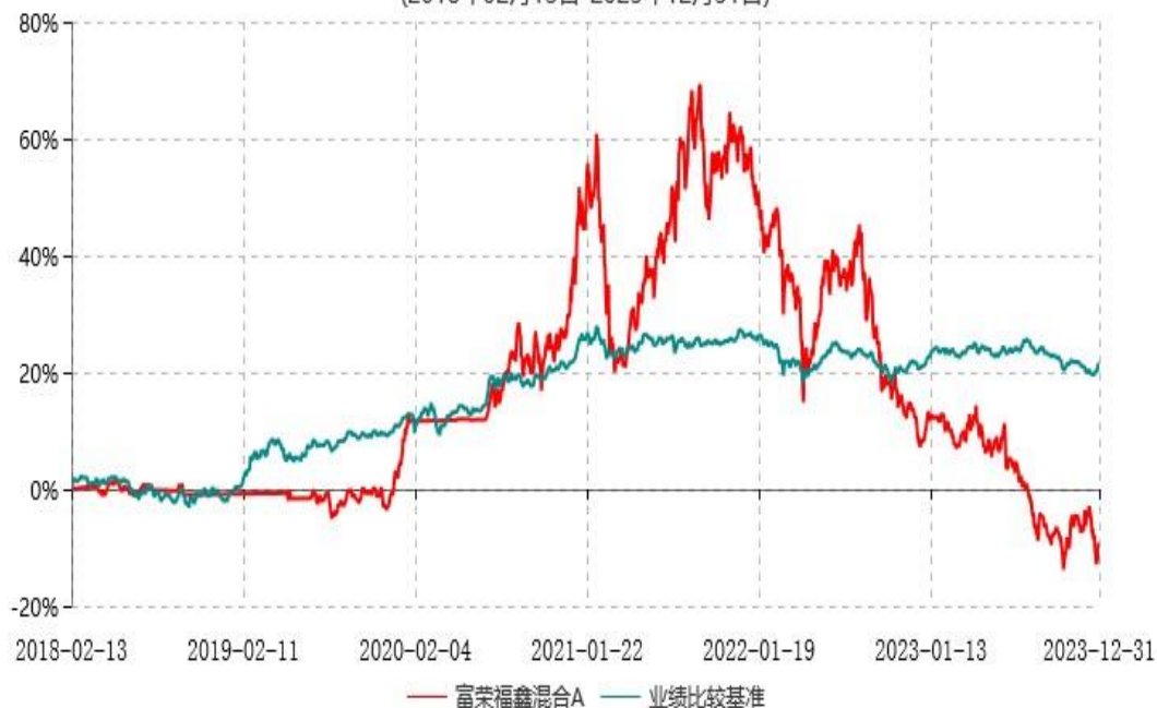
富荣福鑫混合C累计净值增长率与业绩比较基准收益率历史走势对比图